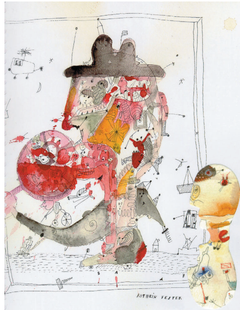
Der Münchner Grafikkünstler Michael Auth hat das Buch Sensi di Vini mit originellen Illustrationen zum Thema ausgestattet.

gibt sich daraus eine weitere Botschaft des Buches: “Die Untersuchung ist eine Bestätigung und ein Plädoyer für das, was ein Sommelier kann und wodurch er sich auszeichnet: sein geschultes Wissen und sein aktives Wahrnehmen beim Weingenuss.” (siehe Interview)